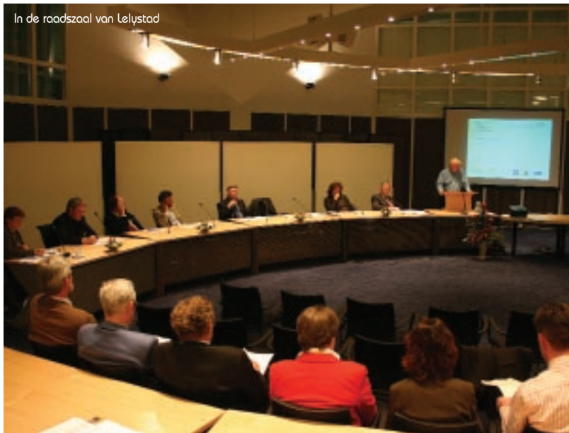
In de raadszaal van Lelystad

leidt naar verhalen van wat technologisch mogelijk – technology push – is. Maar daar staat tegenover de market pull: waar is vraag naar in dit gebied? Het derde is er het groeien naar een veelzijdige oriëntatie tegenover de belevingsaspecten. Ten slotte is er het betalen door Den Haag omzetten naar het betalen door Amsterdam. Er zijn veel meer voorbeelden, maar het inschatten van deze systeembreuken is belangrijk.