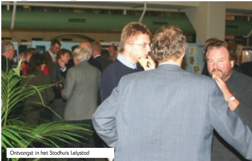
Ontvangst in het Stadhuis Lelystad

Het vierde symposium, dat op 3 november in het stadhuis van Lelystad gehouden werd, had de titel "Infrastructuur in een zich ontwikkelend Flevoland" meegekregen.