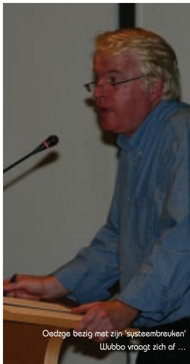
Oedzge bezig met zijn 'systeembreuken' Wubbo vraagt zich af ...

Vraag: Kan de moeilijke bereikbaarheid van de Randstad een voordeel worden voor Flevoland? Zullen op den duur de bedrijven in de Randstad niet naar Flevoland komen, waar de bereikbaarheid